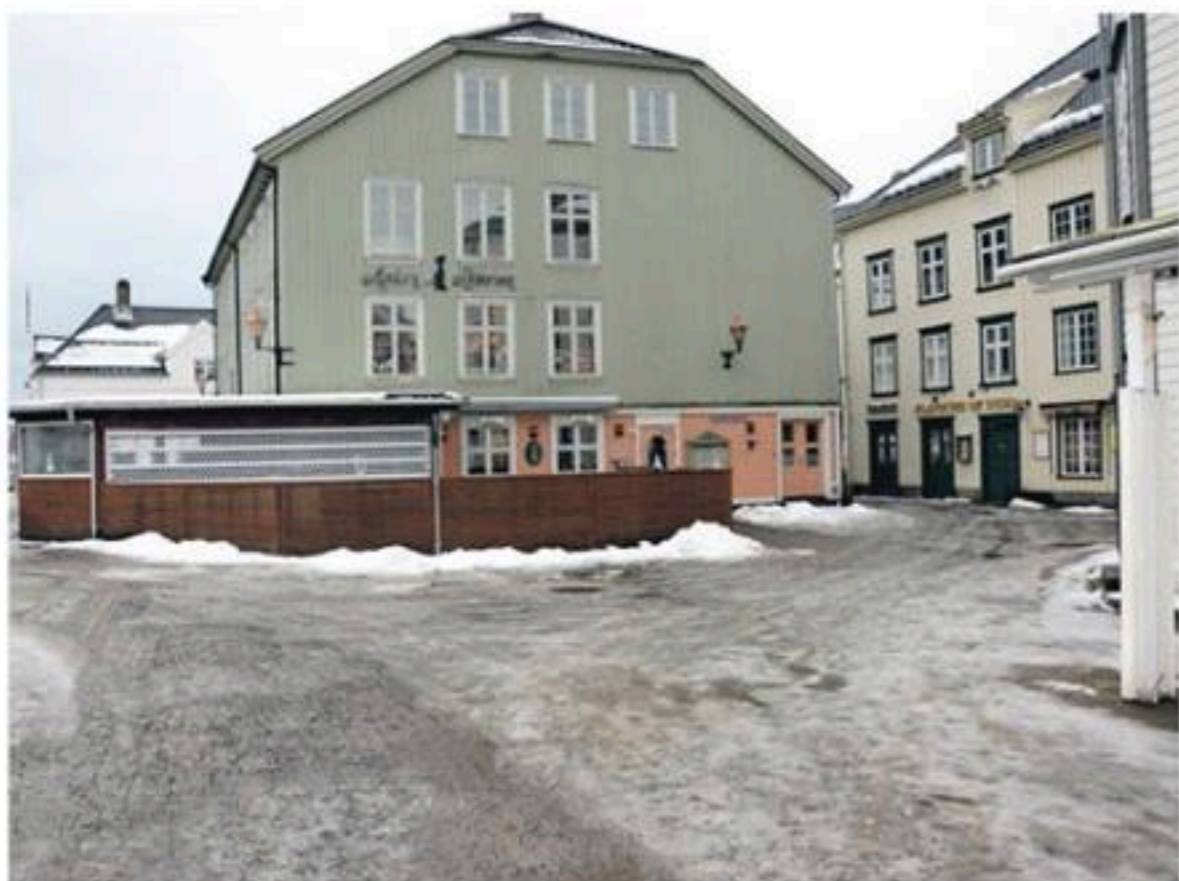
Her blir det folksomt under Tour pub til pub.