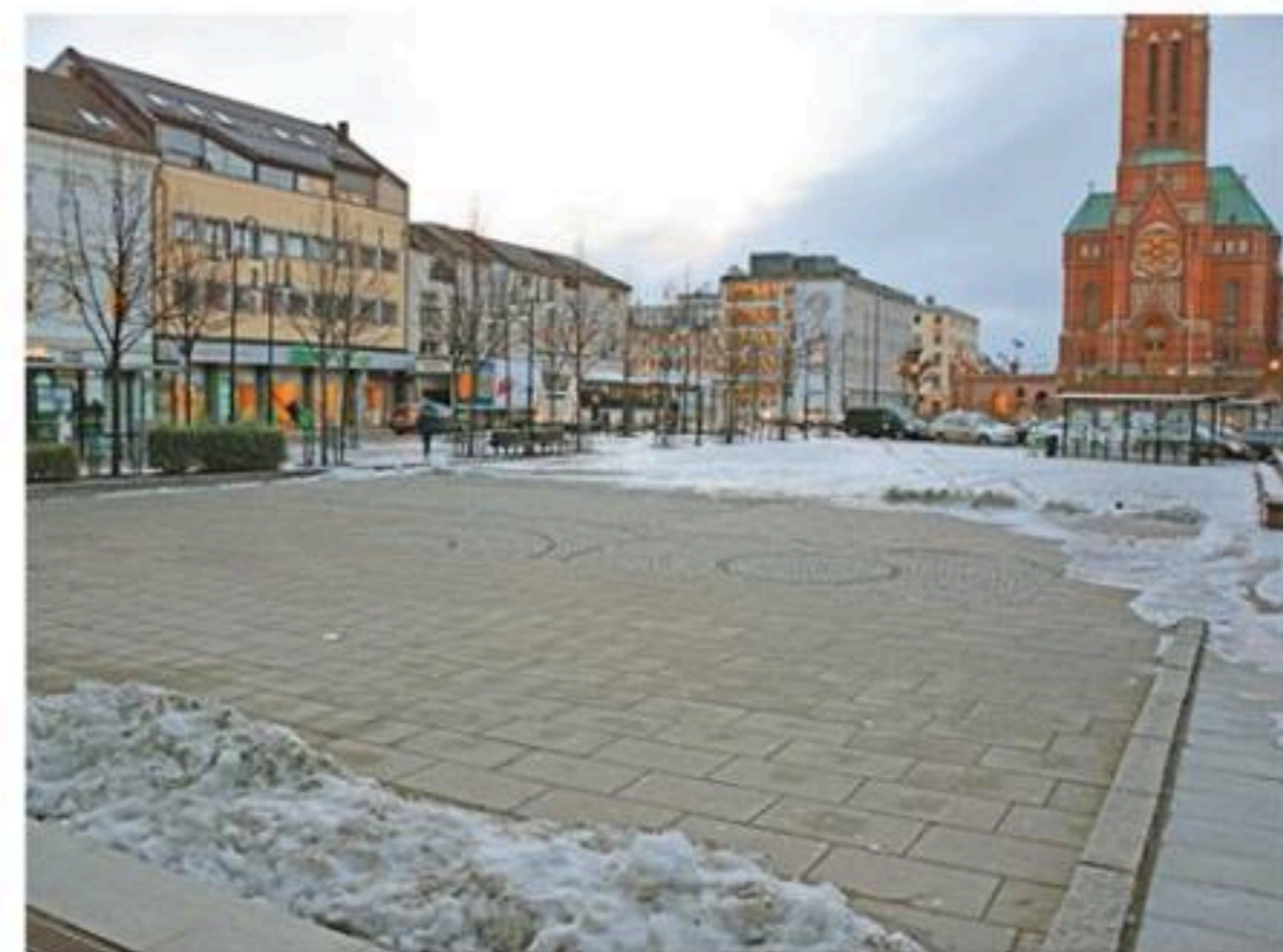
Snø eller ikke, festival blir det uansett.